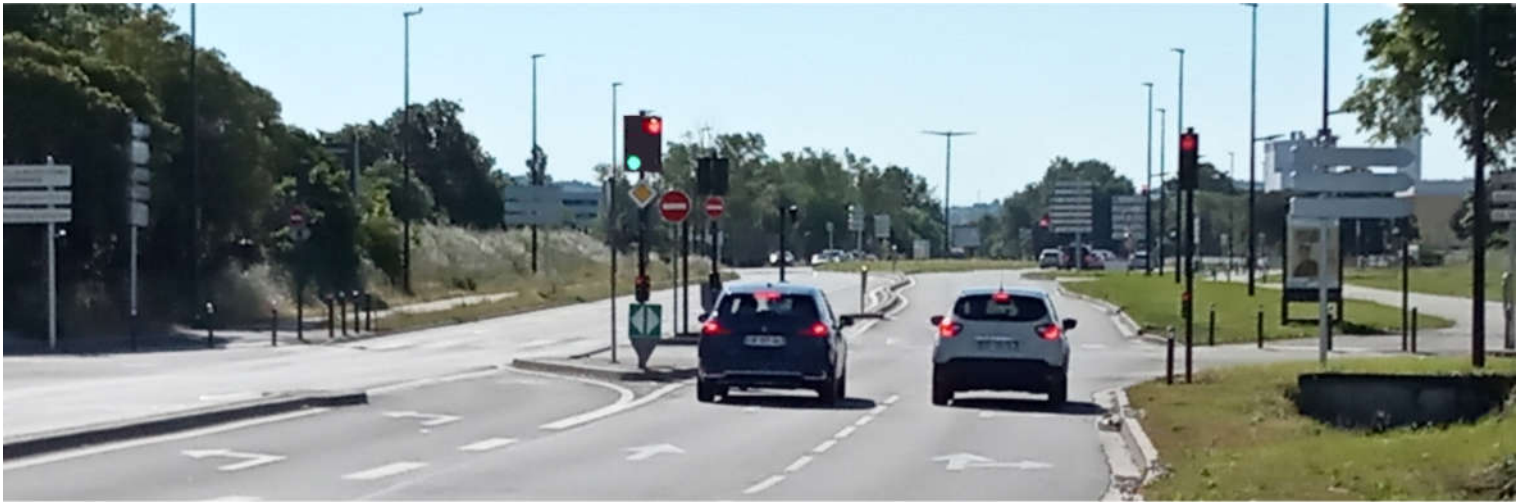
Vue du carrefour (sens rond-point Firmin Pons vers Freescale)

Autre problème remonté à la municipalité, la dangerosité des feux concernant les tourne-à-gauche de cette intersection ; certains automobilistes arrêtés sur les voies de droite démarrant en voyant un feu vert et des véhicules sur leur gauche démarrer, alors que leur feu est rouge, risquant de rentrer alors en collision avec ceux tournant à gauche en face d'eux.